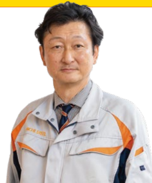
経営役員 営業統括本部長

2024年度から、営業統括本部は営業企画部、トヨタ営業部、特殊鋼営業部、ステンレス営業部の4部門体制となりました。国内外全てのお客様からの信頼を軸に、期待される営業を目指し、価値創造の源泉となる「先読みの顧客ニーズ発掘」で、企画提案する力を磨いてまいります。さらなる成長戦略となる次世代開発テーマの事業化については、開発本部との連携を緊密にして、顧客ニーズへの迅速な対応と、ビジネスモデルの確立を図ります。また、各カンパニーとの協業を強化し「モノづくり力との連携体制」を築き、変化する市場動向に対応していきます。そして、組織を支える営業人材の育成においては、現地現物での理解を徹底しつつ、厳しくも温かい風土の醸成に努めてまいります。