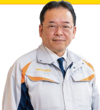
経営役員 モノづくり革新本部長

生産管理部はTPSなどの工場共通の課題や、サプライチェーンに横断する問題に取り組む効率的な仕組みを追求します。ITマネジメント部は、DX推進やサイバーセキュリティの高度化を、設備技術部はTPM活動の深化とIoT活用による設備管理の最適化に取り組めます。また、現場の改善マインド育成のため「見える化」を推進します。成果を明確にすることでやりがいを感じ、自発的かつ継続的に改善が行われる組織にしていきます。