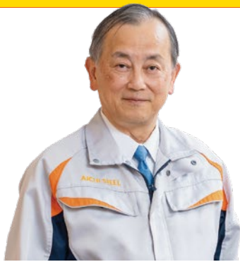
取締役 経営役員 経営企画本部長

先を読み、確実な成長戦略を描き、タイムリーかつダイナミックにリソースを配置します。そして何よりも従業員が誇りを持って働ける、すべてのステークホルダーから信頼される会社となるべく、エシカルでサステナブルな企業として「わくわくするgood company」を目指します。