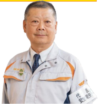
代表取締役 副社長 リスクマネジメント本部長

また、安全・環境・品質マネジメントを通して、すべてのステークホルダーに安全・安心を提供することが必要不可欠です。すべての業務において現地現物で、やるべきことの明確化ができていないか、やるべきこと以外を個人任せにしていないか、の観点から「ルールの制定と遵守」を徹底していきます。全員が「変革のリーダー、私。」を実践することで、よりよい職場風土や環境を醸成し、モノづくりの基盤強化に貢献します。