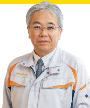
執行職 開発本部長

人材面では、多様な専門性と発想力を活かせる風土を醸成し、積極的に挑戦するマインドを育むことで、活力ある組織を作り、新たな価値を社会に提供するプロ集団を目指します。